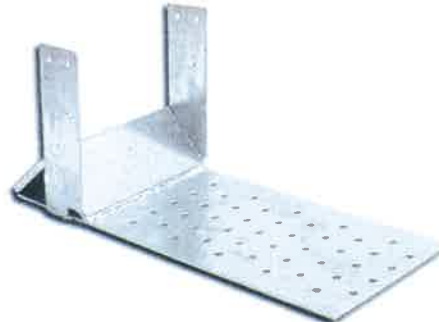
Typ H (Holz)