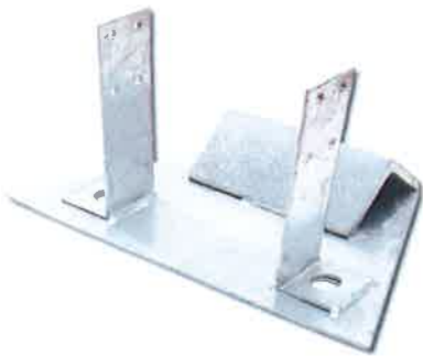
Typ B (Beton)